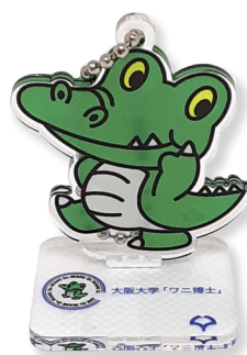
副賞：ワニ博士キーホルダー

■主催：いのち会議、大阪大学 社会ソリューションイニシアティブ (SSI) ■後援：2025年日本国際博覧会協会、大阪府教育庁 (予定) ほか ■お問い合わせ先：いのち会議 事務局 (大阪大学社会ソリューションイニシアティブ内) E-mail: ssi2@ml.office.osaka-u.ac.jp